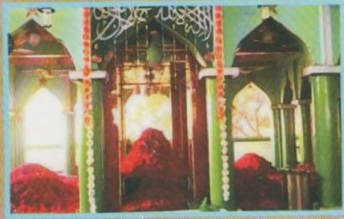
آستانہ حضرت محمد و اسید چودہوں پیراں (علیہم الرحمۃ والرضوان) الہ آباد

و باطنی مرضوں سے محفوظ رہنے والا جسم عطا فرماتا کہ ہم تیری عبادت کریں اور تیرے حبیب مکرم کے راستے کی پیروی کریں۔ اے میرے اللہ بے شک میں تجھ سے اللہ کی تلوار محمد ﷺ جو کہ اللہ کے رسول ہیں ان کی حرمت و عزت کے واسطے سے ہر اس بھلائی کا سوال کرتا ہوں جسے تو جانتا ہے۔ اے میرے اللہ تو حضرت جبرئیل و حضرت میکائیل و حضرت اسرافیل و حضرت عزرائیل اور عرش کے اٹھانے والوں اور کراماً کاتبین و منکر و کبیر اور اپنے تمام آسمان وزمین میں مقرب ترین فرشتوں پر خوب خوب درود نازل فرما۔ اے ہمارے پالنہا تو ہماری طرف سے قبول فرمالمے بے شک تو سننے والا جاننے والا ہے اور ہم پر رجوع فرما بے شک تو ہی تو بے قبول کرنے والا بڑا رحم فرمانے والا ہے پس اللہ تعالیٰ اپنے حبیب اور اپنے نور محبت محمد ﷺ آپ کی آل و ازواج اور ذریات آپ کے اصحاب و احباب پر اور آسمان وزمین میں رہنے والے آپ کی امت کے تمام اولیا پر ہر لمحہ ہر سانس میں اپنی تمام معلوم تعداد کے مطابق خوب خوب درود و سلام اور رحمت و برکت نازل فرمائے آمین آمین۔