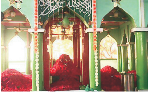
آستانہ حضرات مخدومین سادات چودہوں پیراں (علیہم الرحمۃ والرضوان) الہ آباد

اللہ کی تلوار محمد صلی اللہ علیہ وسلم جو کہ اللہ کے رسول ہیں ان کی حرمت و عزت کے واسطے سے سوال کرتا ہوں کہ تو ہمیں تمام تکلیفوں تمام گمراہیوں، مصیبتوں، عیبوں، تمام الزامات، حوادث و بلیات سختیوں تمام رنج و غم اور قرضوں سے محفوظ فرما دے اے فریادی کی فریاد کو پہنچنے والے میں تیری رحمت اور عزت کے واسطے سے فریاد کر رہا ہوں اے دروازوں کو کھولنے والے تو ہم سب پر اپنی طرف رجوع کرنے کے دروازے کھول دے تو ہم پر اپنی مغفرت اور رحمت کے دروازے کھول دے اس ذات کا واسطہ ہے جس کے امر سے زمین و آسمان قائم ہیں۔